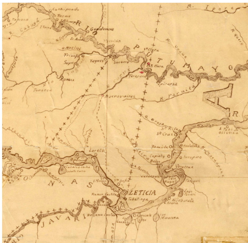
Imagen 22. Detalle del mapa de Límites entre Ecuador, Colombia y Perú, 1933.

Fuente: Realizado en 1933, en el cual se puede apreciar la población de Leticia y el denominado trapezio amazónico entre el río Putumayo y el Amazonas. Biblioteca Nacional de Colombia, Fondo Mapoteca, 986, figac. 18.