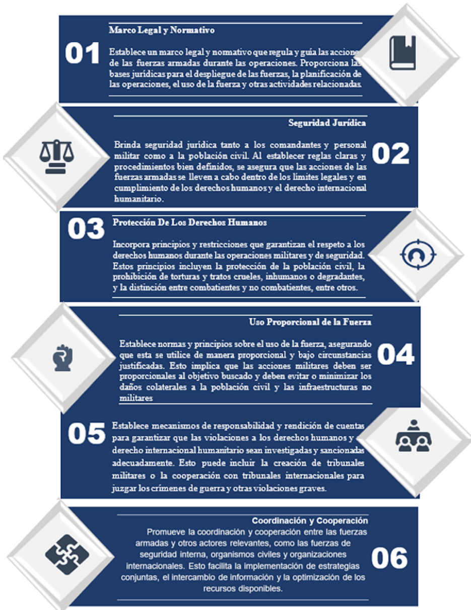
Figura 2. Elementos para el desarrollo de operaciones

Estos antecedentes forjaron la creación del derecho operacional con la función de proporcionar a las fuerzas en desarrollo de operaciones elementos clave para la ejecución de las operaciones (Figura 2).