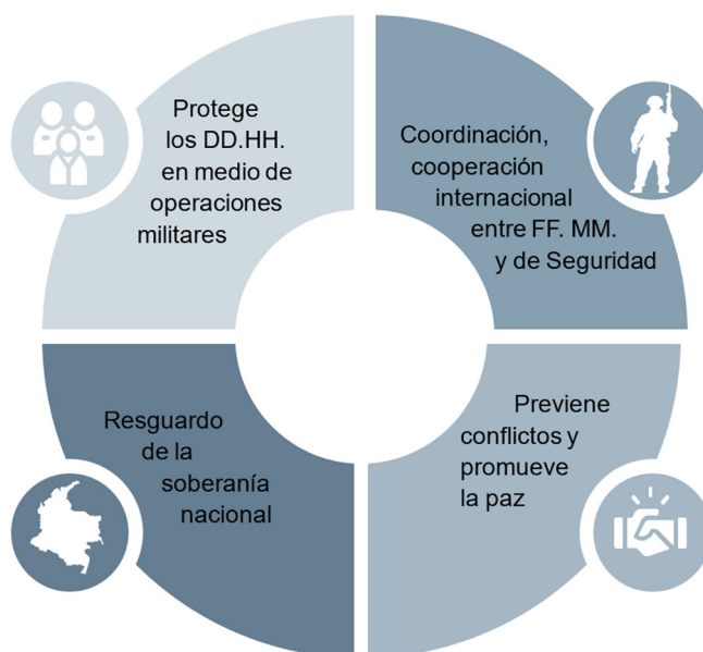
Figura 1. Funciones del derecho operacional