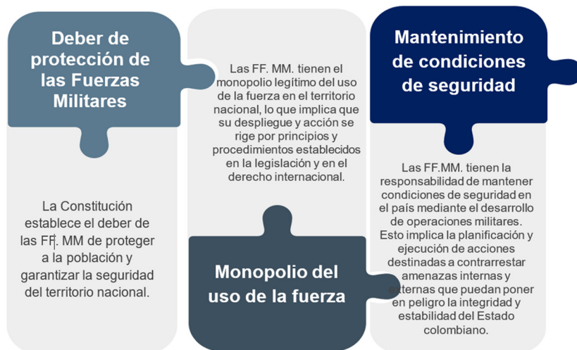
Figura 5. Premisas del derecho operacional basadas en la Constitución Política de 1991