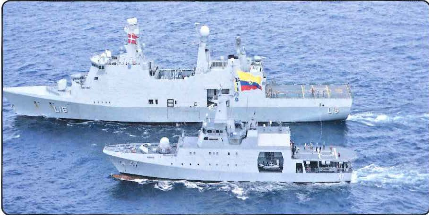
Buque tipo OPV-80, el ARC "7 de agosto" (número casco 47) de la Armada Republica de Colombia, operando en el Cuerno de África (Costas de Somalia) durante la Operación Atalanta (2015) en apoyo a las Fuerzas Navales de la Unión Europea EUNAVFOR combatiendo la piratería. Maniobra con el buque de la Armada de Dinamarca KDM Absalón (L16).

Así como en los siglos precedentes fue necesario establecer los convoyes para enfrentar con éxito al enemigo debido a los ataques piratas, de la misma forma fue necesario implementar esta medida durante la Segunda Guerra Mundial donde los convoyes sirvieron para proteger el suministro de gran parte del apoyo logístico que requerían los países aliados. La misma estrategia se ha empleado en las recientes guerras y ante situaciones complejas como el caso que enfrenta la Operación Atalanta, mediante la cual la Unión Europea busca proteger los buques mercantes que transitan cerca a las costas de Somalia debido a los permanentes actos de piratería que afectan la libre navegación. Le han asignado a las Armadas de sus Estados miembros la protección de los buques que transitan por estas áreas, operación que ha contado también con la colaboración de otros países amigos, como es el caso de la participación de la Armada de Colombia con el OPV (Ocean Patrol Vessel) ARC "7 de agosto" en el año 2015.