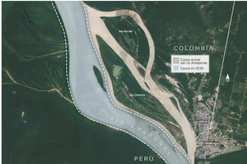
Figura 9.2. Estado actual del cauce del río Amazonas y su proyección al 2030